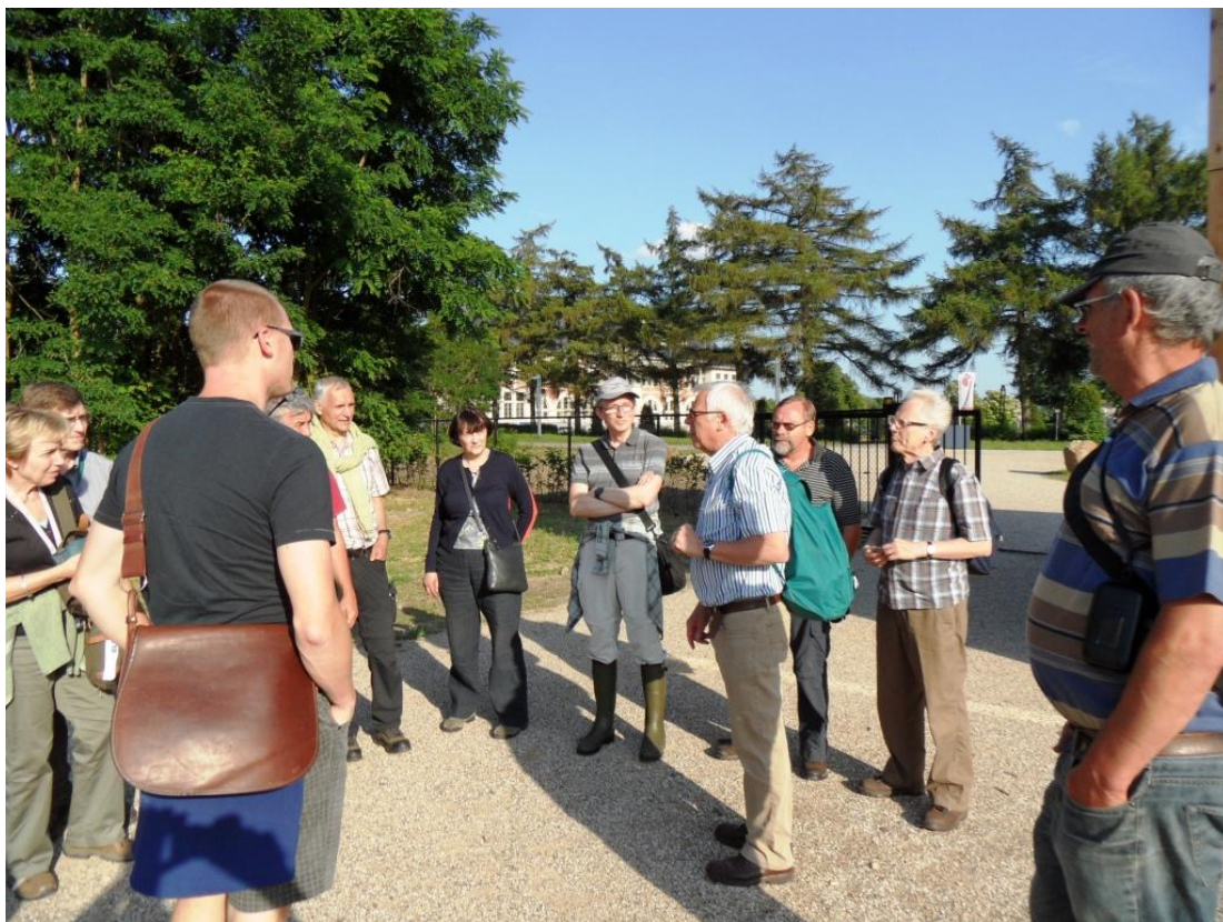
De gids in het centrum van de belangstelling